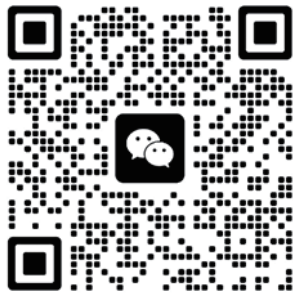
[ 技术支持 ]