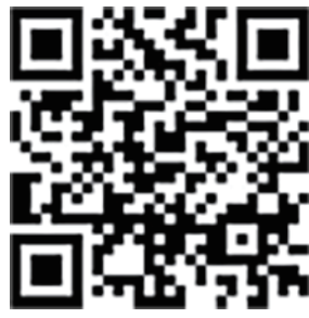
[ 官网了解更多 ]